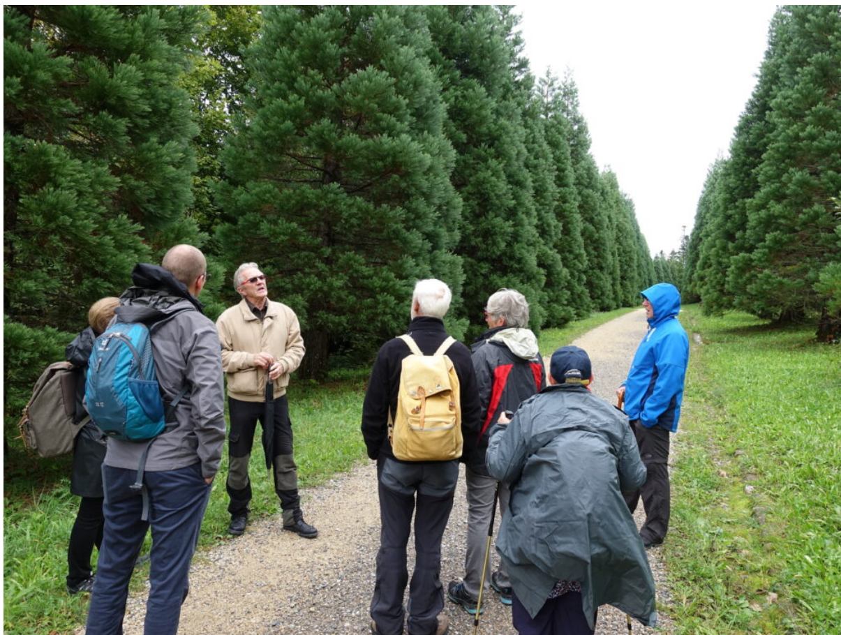
Waldführung und Grill, 5. Oktober 2019