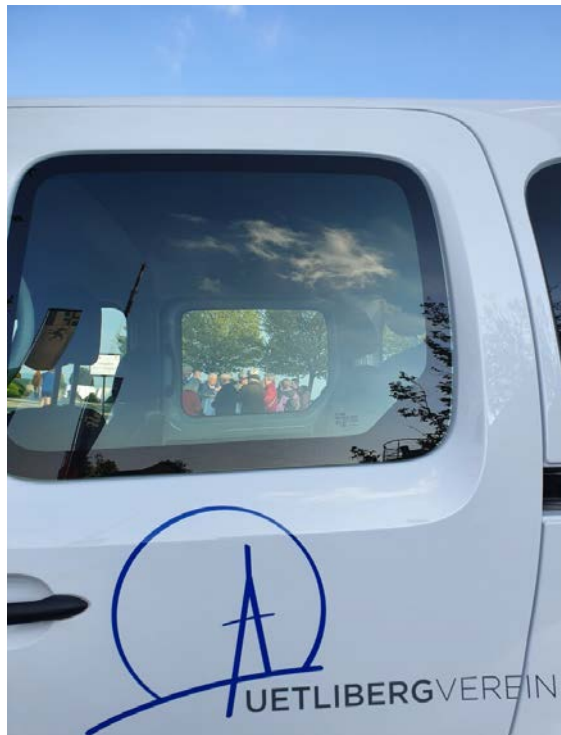
Unser Vereins-Logo auf dem Transportfahrzeug